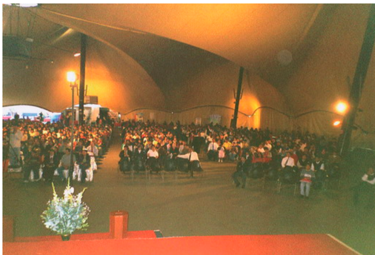
Immagine di una riunione a Lima, Perù, in ottobre 2005.

In questo opuscolo possiamo pubblicare solo alcune delle molte fotografie scattate nel mondo intero. La messe è grande.