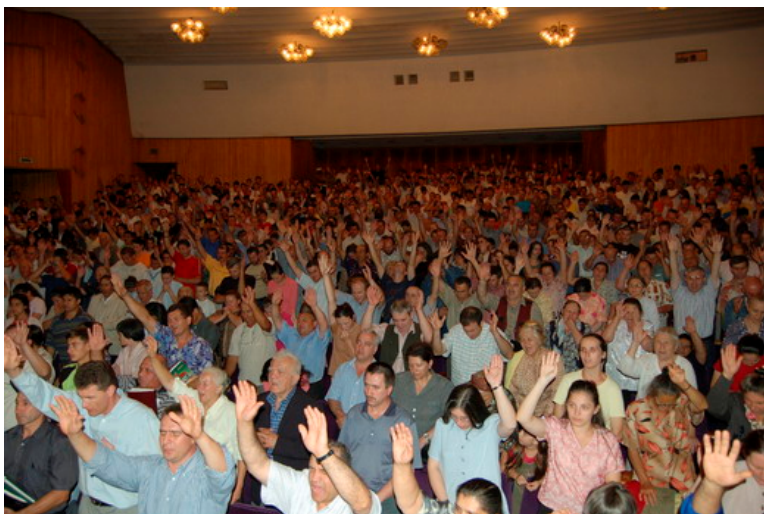
Fotografia di una riunione in Romania in agosto 2006.

In questo opuscolo possiamo pubblicare solo alcune delle molte fotografie scattate nel mondo intero. La messe è grande.